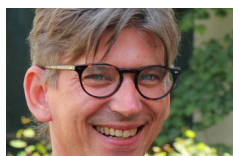
Jiří Strach režisér