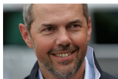
Marek Eben herec