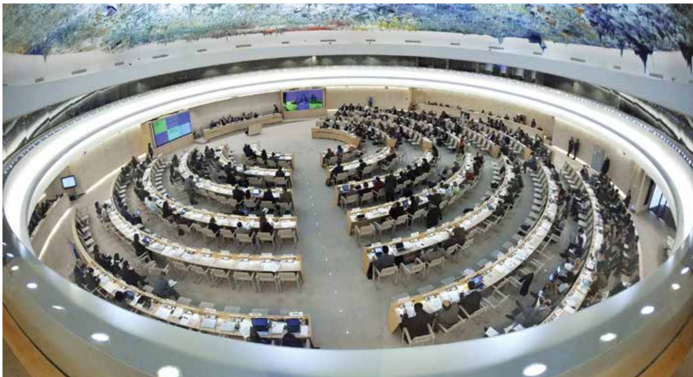
Šestnácté zasedání Rady OSN pro lidská práva v Ženevě v roce 2011