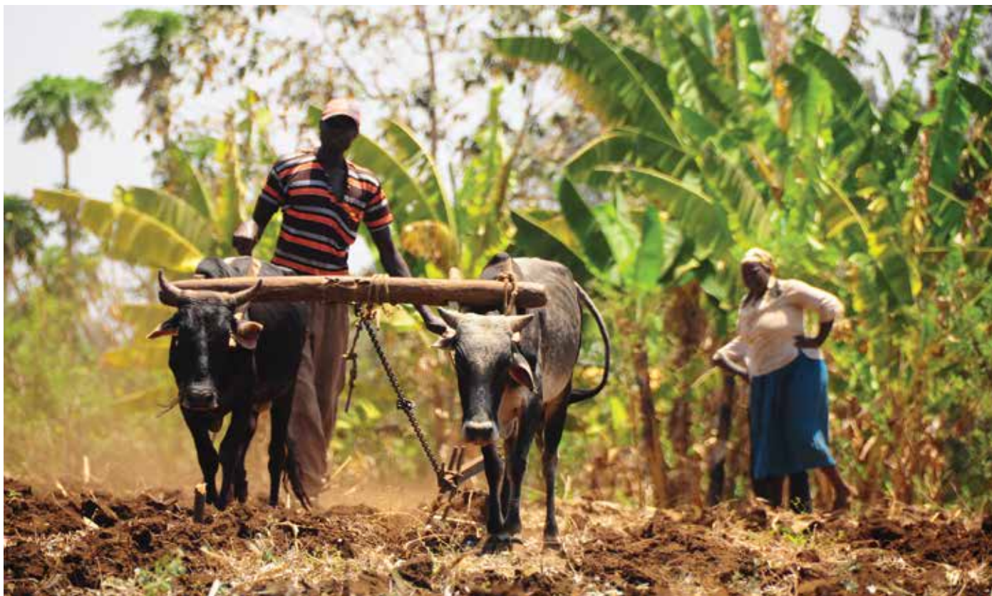
Pro Keňu má zemědělský venkov stále zásadní význam, stejně jako rodina založená na vztahu jednoho muže a jedné ženy.