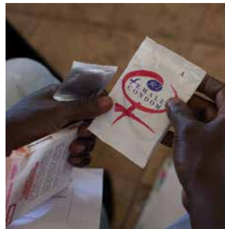
Rozdávání ženských kondomů v rámci projektu WHO, UNFPA, UNICEF aj. „na podporu sexuálního a reprodukčního zdraví“

Výsledkem tohoto vyhodnocení byla identifikace členských států, které se odmí- tají podříditi jejich agendě – jednu z hlav- ních překážek spatřují ve Svatém stolci. Nově se tyto organizace rozhodly prioritně zaměřit na děti a mládež. Oni nepřestanou vyvíjet aktivitu na prosazení sexualizace mládeže, neomezeného provádění potratů a přidružených ideologických záměrů. Po- kud nechceme obětovat děti a žít ve světě podle jejich představ, nesmíme jim nechat volnou ruku v jejich působení.