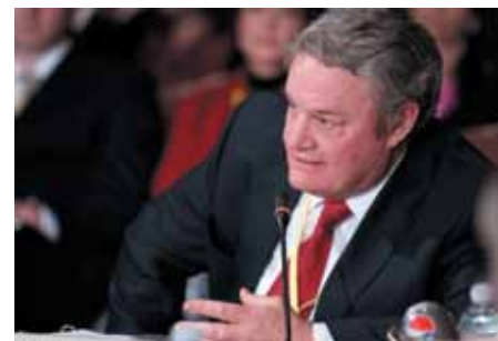
Governér Severní Dakoty Jack Dalrymple