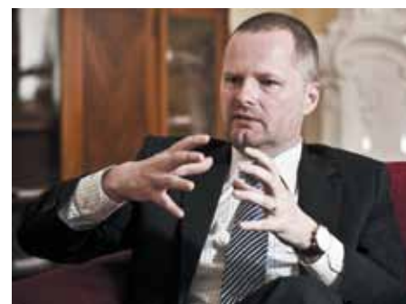
Ministr školství Petr Fiala