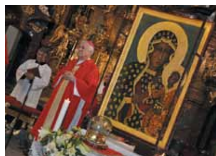
Pouť Od oceánu k oceánu s ikonou Panny Marie Čenstochovské