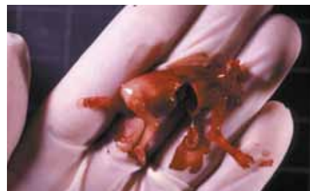
Dítě usmrcené v 11. týdnu od početí