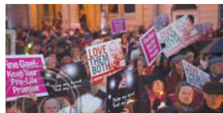
Dublinská vigilie pro život