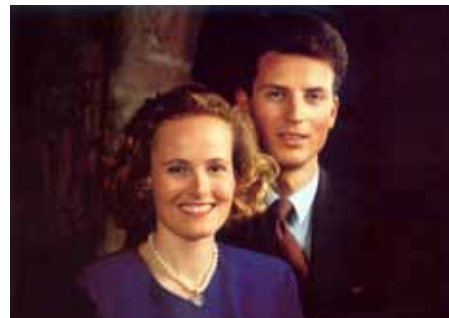
Dědičný kníže Alois a princezna Sophie