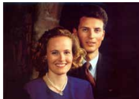
Dědičný kníže Alois a princezna Sophie