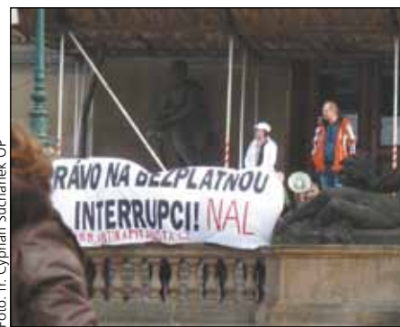
nechybělo ani asi deset protestujících biskup Andreas Laun jako pastýř včele