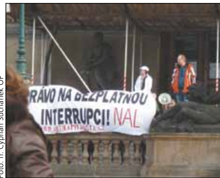
nechybělo ani asi deset protestujících biskup Andreas Laun jako pastýř včele