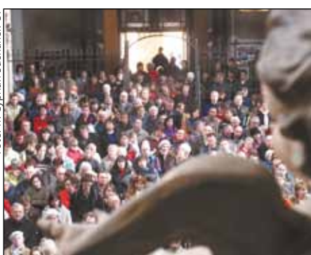
kostel sv. Jiljí byl zcela zaplněn