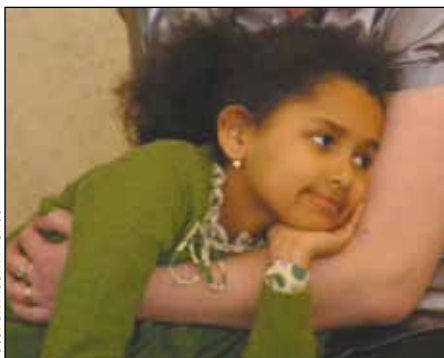
spokojená účastnice dopolední konference