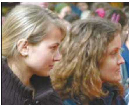
na mši sv. se u kázání se neusínalo