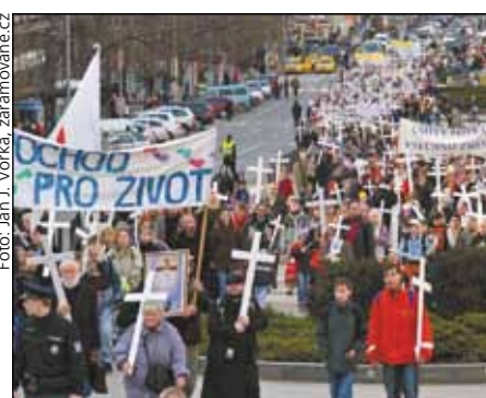
účastníků bylo přes dva tisíce

kup Andreas Laun. Pochod pro život byl ukončen před 16. hodinou u sochy svatého Václava Svatováclavským chórem a českou státní hymnou.