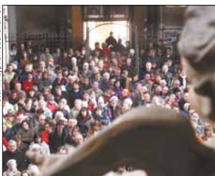
kostel sv. Jiljí byl zcela zaplněn