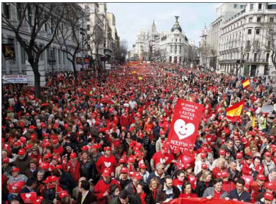
Pochod pro život v Madridu