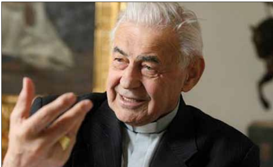
Miloslav kardinál Vlk