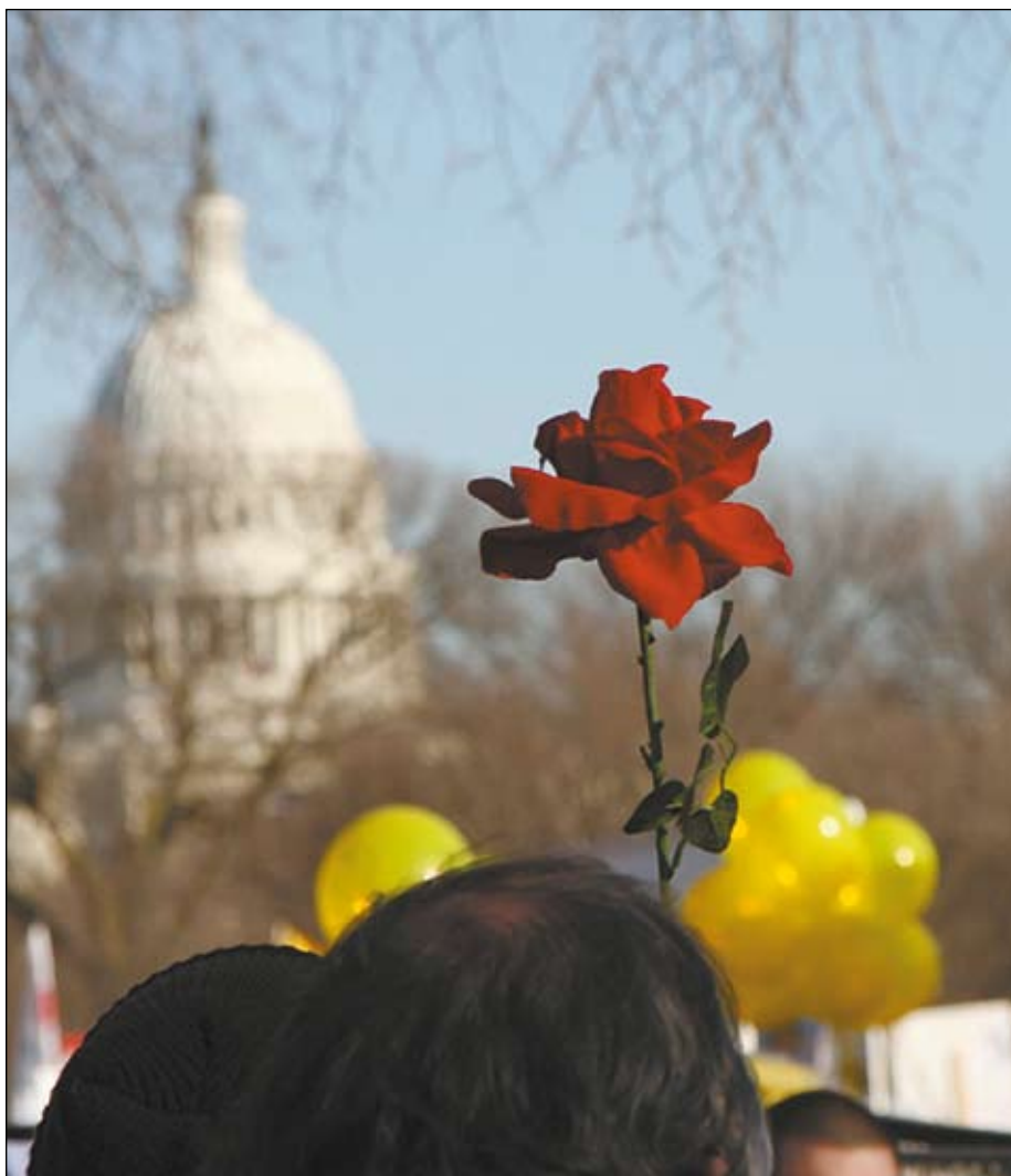
Washington, D.C. – Pochod pro život 2009