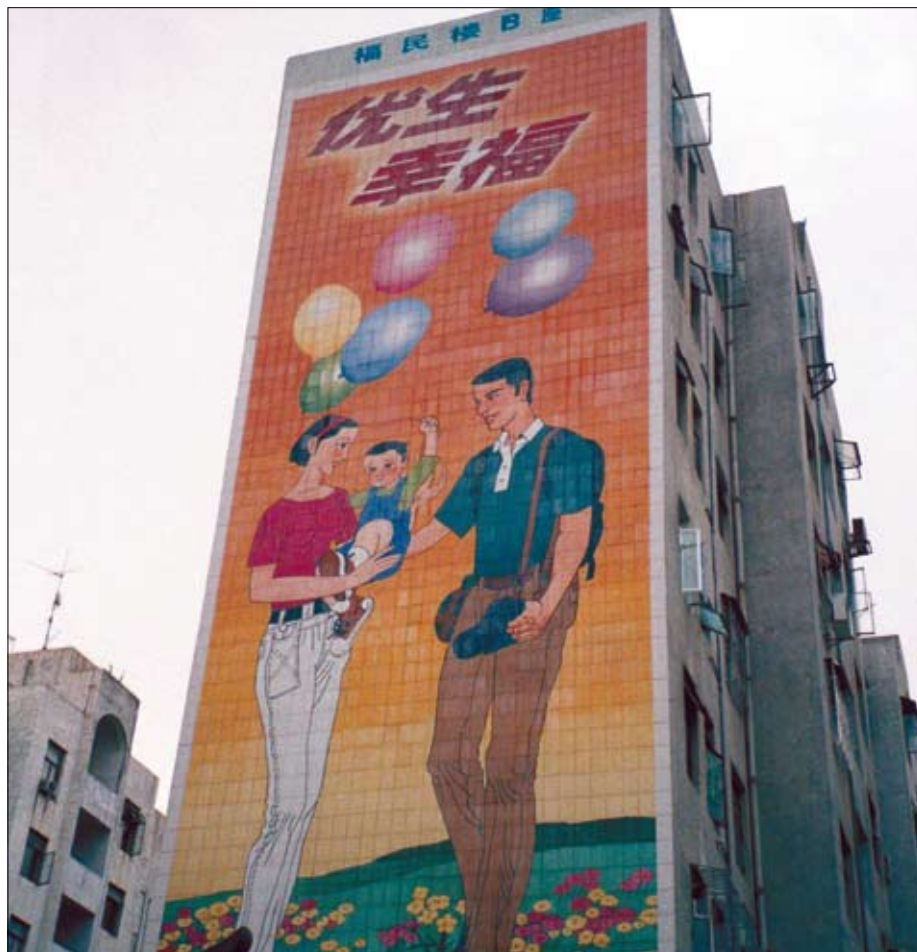
Billboard propagující politiku jednoho dítěte

Tato politika je zde označena za „nejrozsáhlejší sociálně-inženýrský experiment na světě“. Film se zaměřuje na představení těžkého osudu dětí, prodaných svými rodiči jinému, dosud bezdětnému páru, aby se vyhnuli postihu a šikanování ze strany státu.