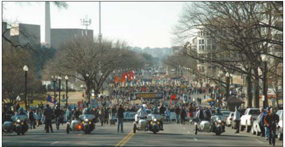
Washington, D.C. – Pochod pro život 2009

Nový americký prezident Barack Obama naopak rozsudek podpořil a den poté zrušil Bushův zákaz financování potratů v zahraničí z peněz daňových poplatníků. Obama rovněž oznámil, že obnoví financování Populačního fondu OSN. Bush financování zastavil, protože Fond podporuje čínskou násilnou kontrolu populace. Navíc chtěl Obama podpořit antikoncepci a potratový průmysl bilióny