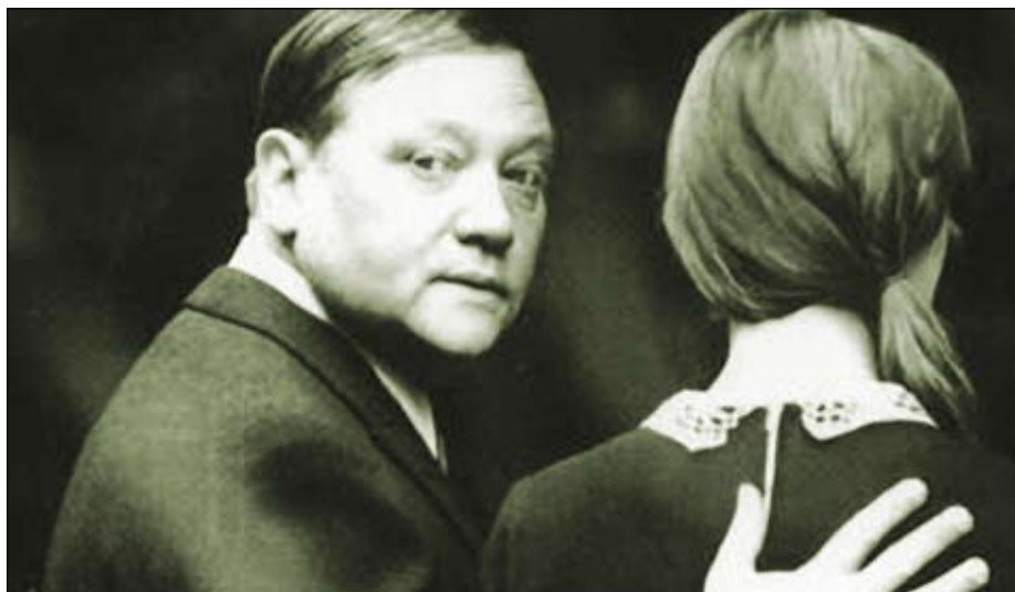
Rudolf Hrušínský ve filmu „Spalovač mrtvol“ (1968)