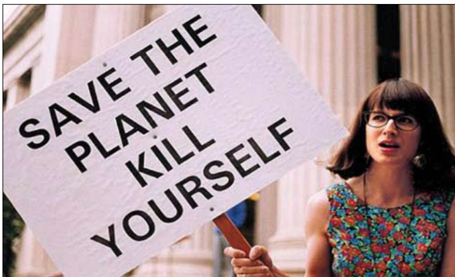
„Zahraňte planetu. Zabijte se.“