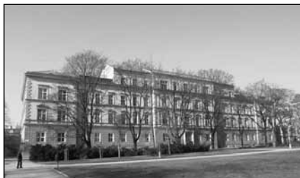
Porodnice na Obilním trhu v Brně

Krajský soud v Brně ve svém rozhodnutí neshledal na činnosti HPŽ ČR žádné pochybení. Konstatoval, že na straně demonstrantů žádné překročení právních norem, jež se mohou k takové formě vyjadřování vztahovat, nenašel.