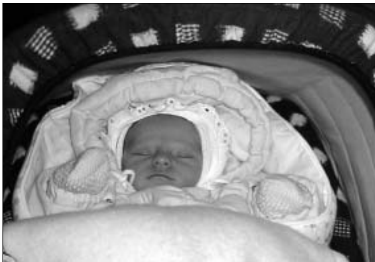
Verunka v autosedačce při cestě z porodnice domů

Chtěla volit cestu tzv. přímé adopce, tj. situace, kdy dítě po propuštění se svou matkou z porodnice přejde ještě týž den do péče budoucích osvojitelů, o kterých matka získá informace, které potřebuje (tj. nakolik je to rodina stabilní a funkční, zajištěná tak, aby se o její dítě mohla dobře postarat atd.) a navíc je osobně pozná.