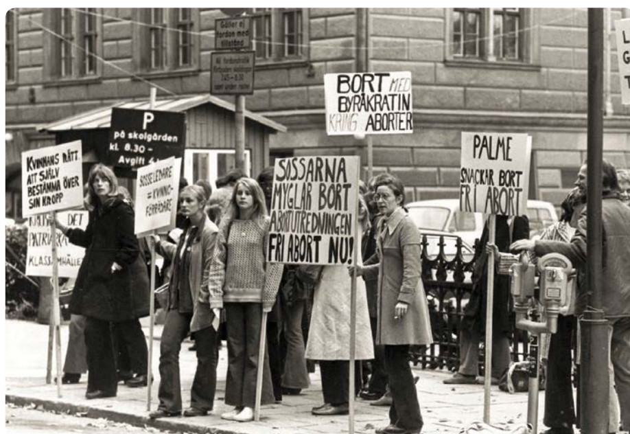
Skupina 8 demonstruje v roce 1972 ve Stockholmu za právo na bezplatný potrat.

Klíčovým inspirátorem švédského neomalthusiánského hnutí byl anglický lékař George Drysdale, autor knihy The Elements of Social Science z roku 1854. Jeho pohled na sexualitu a lásku byl striktně materialistický, velký důraz kladl na hygienu a kvalitu života jedince.