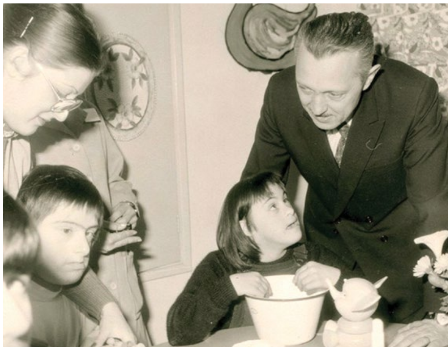
Profesor Jérôme Lejeune se svými pacienty.

Pravá povaha současného diskurzu o potratech nemá co do činění s vědou, ale právě s eugenikou, ideologickým blížencem všech těch „moderních vědeckých“ pohledů na člověka.