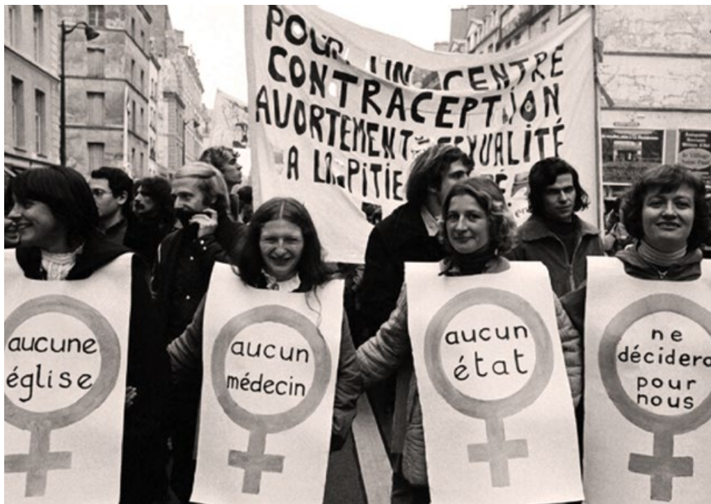
Demonstrace za právo na potrat (1979): „Žádná církev, žádný lékař, žádný stát nebude rozhodovat za nás.“

Manifest byl zveřejněn v časopise Le Nouvel Observateur s podpisy 343 žen, které hrdě uvedly, že podstoupily nelegální potrat, a obsahoval jména mnoha známých osobností.