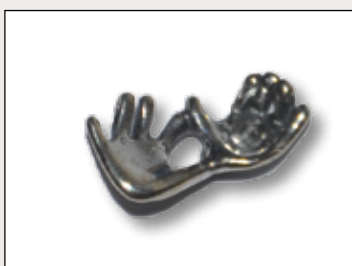
Ručičky ve 12. týdnu těhotenství ve skutečné velikosti, k připnutí na oděv