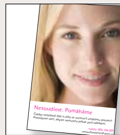
Nesoudíme. Pomáháme letáky vhodné do čekáren, ordinací, lékáren, infocenter...