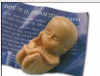
Model dítěte ve 12. týdnu těhotenství ve skutečné velikosti

Materiály můžete objednat na webu hnutiprozivot.cz nebo na emailu info@hnutiprozivot.cz , příp. zašlete tento formulář na adresu Hnutí Pro život ČR, Hlubočepská 85/64, 152 00 Praha.