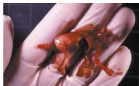
Dítě usmrcené v 11. týdnu od početí