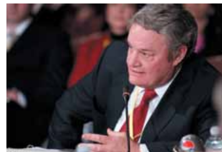
Governér Severní Dakoty Jack Dalrymple