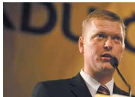
Pavel Bělobrádek, předseda KDU-ČSL

Číslo účtu: 2900089089/2010 Variabilní symbol: 6036