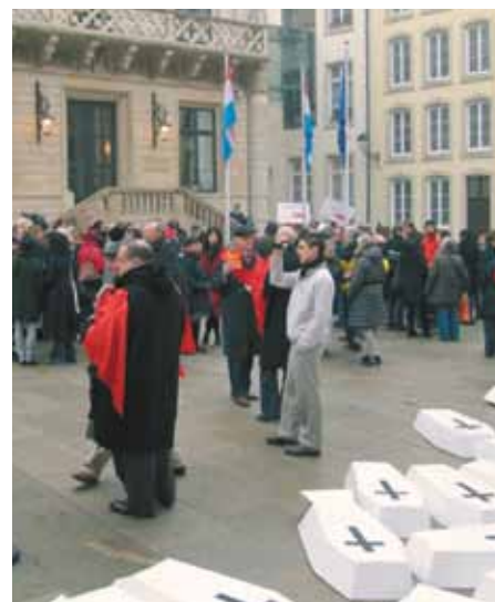
Demonstrace před lucemburským parlamentem