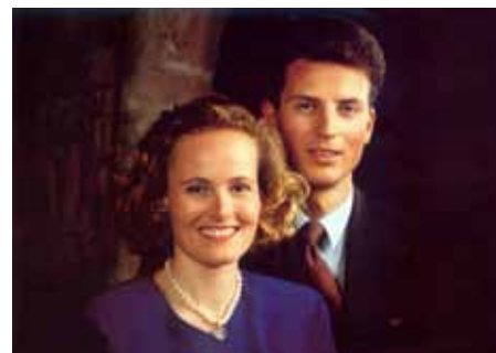
Dědičný kníže Alois a princezna Sophie