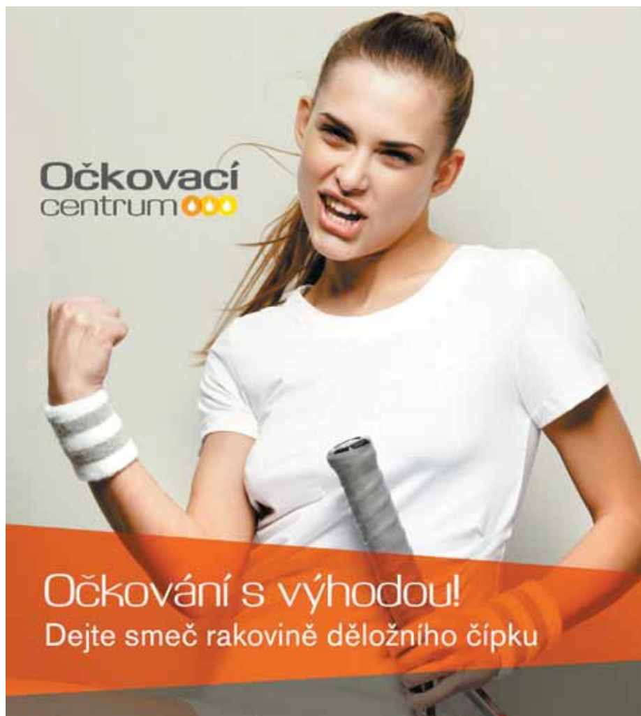
Reklamní leták propagující očkování

Lidské papillomaviry napadají buňky kůže a sliznic a výsledkem je řada onemocnění od nezhoubných kožních a slizničních výrůstků, bradavic, kondylomat až po výše zmíněný zhoubný nádor. Smrtelně nebezpečný virus může sedět a číhat ve sliznicích pochvy, zevních rodidel, konečníku, dutiny ústní a penisu. Od klíky u dveří se virus nepřenese, zato dotykem pohlavních orgánů ústy ano. Těhotné ženy nakažené nízkorizikovými typy papillomavirů, které vytváří genitální bradavice, sice rakovinu nedostanou, ale mohou při