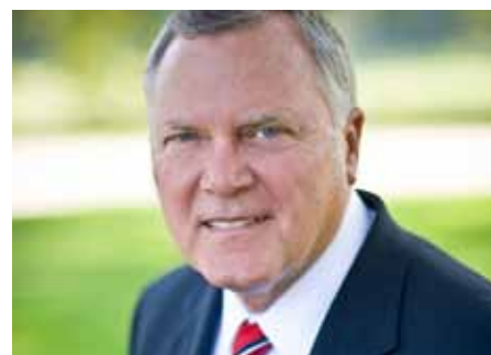
Nathan Deal, guvernér Georgie