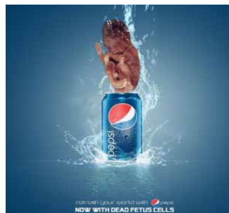
Bojkot PepsiCo: „Nyní s kousky mrtvých buněk plodů“