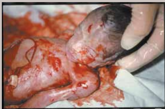
Fotografie z DVD Svoboda volby . Několikaminutový dokument je vhodný především k diskusi se zatvzřelými obhájci současného zákona o umělých potratech.