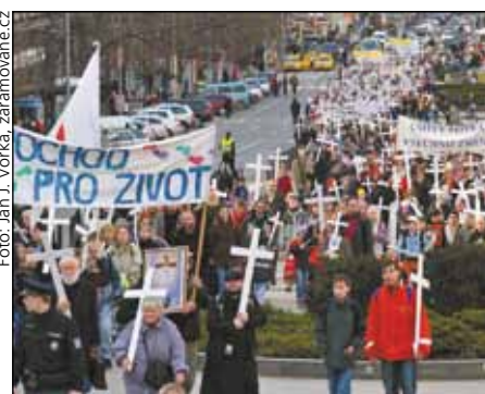
účastníků bylo přes dva tisíce

kup Andreas Laun. Pochod pro život byl ukončen před 16. hodinou u sochy svatého Václava Svatováclavským chórem a českou státní hymnou.