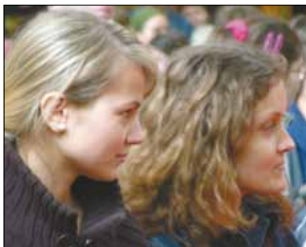
na mši sv. se u kázání se neusínalo