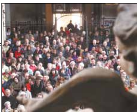
kostel sv. Jiljí byl zcela zaplněn