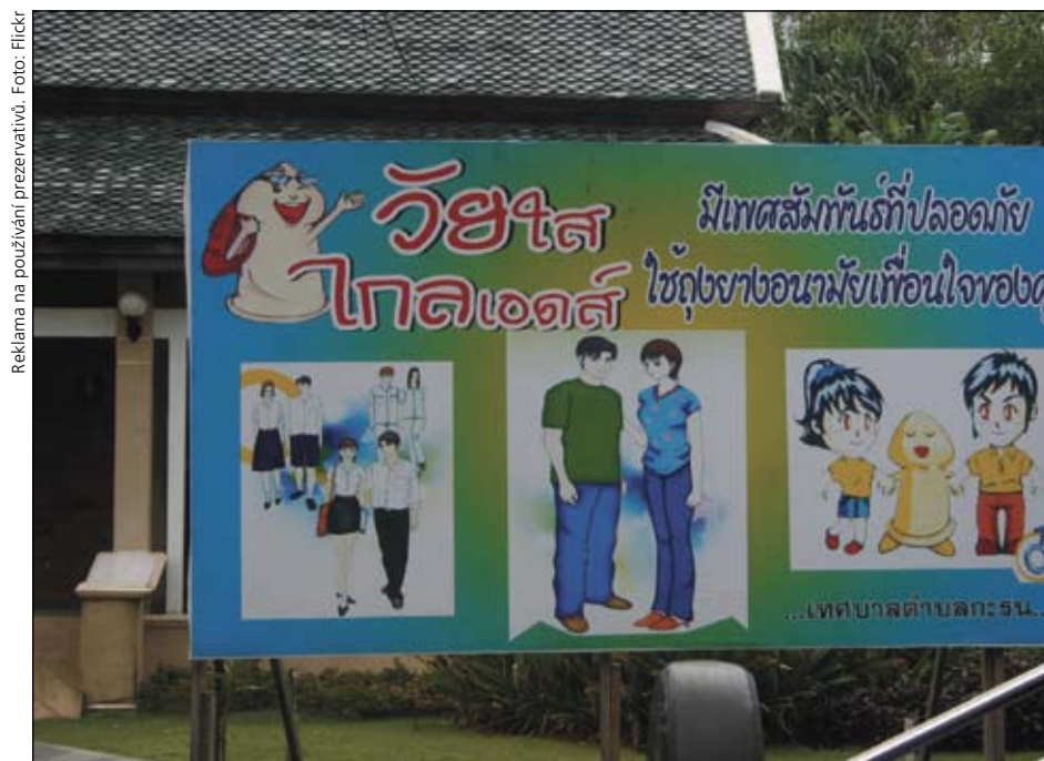
Reklama na používání prezervativů.