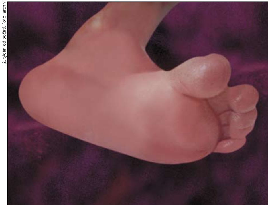
12. týden od početí.

maskovanou šroubovanou větvičkou „Embryo je stádium vývoje člověka“ (život člověka pochopitelně z hlediska přírodních věd zahrnuje všechna stadia svého vývoje, která prožil, od zygoty po starce). Poté, co utrousil tuto zamaskovanou nepříjemnou skutečnost, přesunuje se do oblasti filosofie, kde hodlá nahnat zpět ztracené body. Uvědomme si tedy, že zatím jako vědec přiznal, že embryo je člověk a v tomto okamžiku opouští pole své odbornosti – embryologie a stává se filosofem-amatérem.