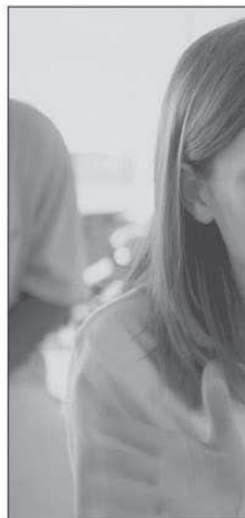
Život - 18. ročník

LINKA POMOCI 800 108 000 ČEKÁTE-LI NEČEKÁTE